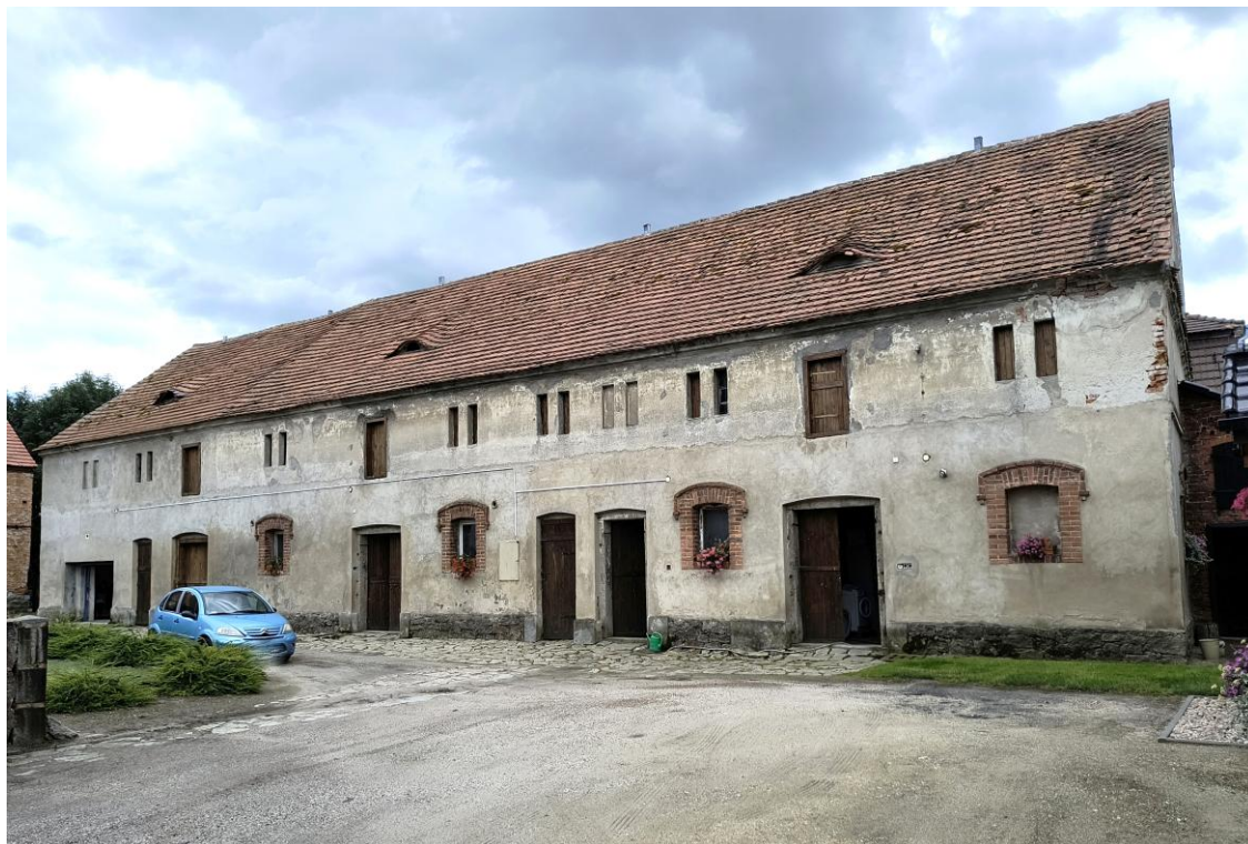
Widok od północnego zachodu

7. Fotografia z opisem wskazującym orientację w stosunku do sąsiednich terenów lub stron świata albo mapa z zaznaczonym stanowiskiem archeologicznym