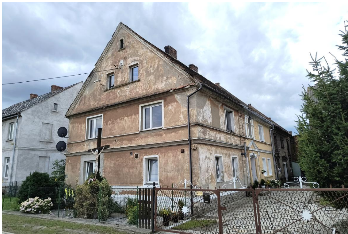
Widok od północnego wschodu

7. Fotografia z opisem wskazującym orientację w stosunku do sąsiednich terenów lub stron świata albo mapa z zaznaczonym stanowiskiem archeologicznym