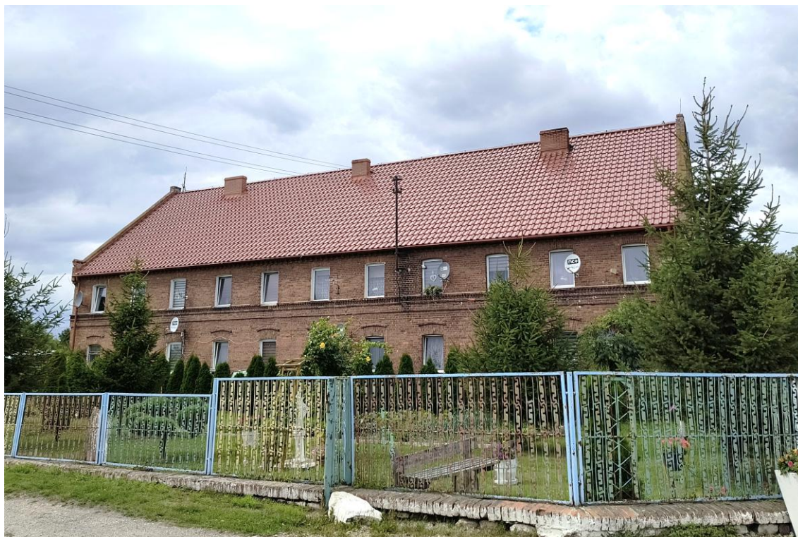
Widok od południowego wschodu

7. Fotografia z opisem wskazującym orientację w stosunku do sąsiednich terenów lub stron świata albo mapa z zaznaczonym stanowiskiem archeologicznym