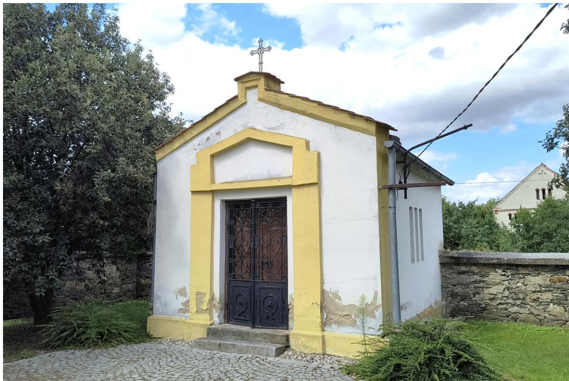
Widok od południowego zachodu

7. Fotografia z opisem wskazującym orientację w stosunku do sąsiednich terenów lub stron świata albo mapa z zaznaczonym stanowiskiem archeologicznym