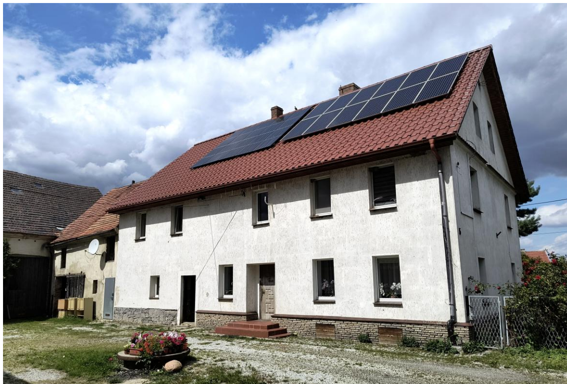
Widok od południowego wschodu

7. Fotografia z opisem wskazującym orientację w stosunku do sąsiednich terenów lub stron świata albo mapa z zaznaczonym stanowiskiem archeologicznym