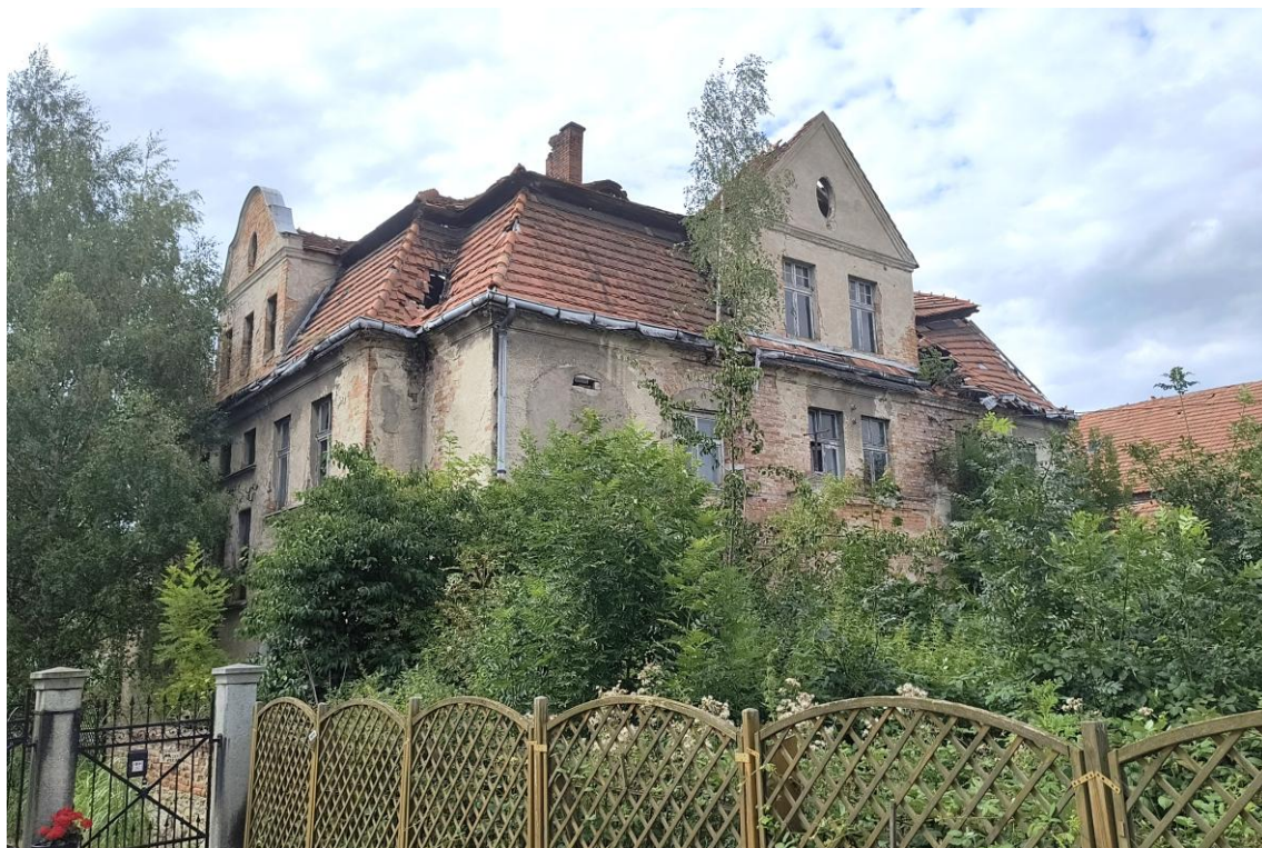
Widok od południowego wschodu

7. Fotografia z opisem wskazującym orientację w stosunku do sąsiednich terenów lub stron świata albo mapa z zaznaczonym stanowiskiem archeologicznym