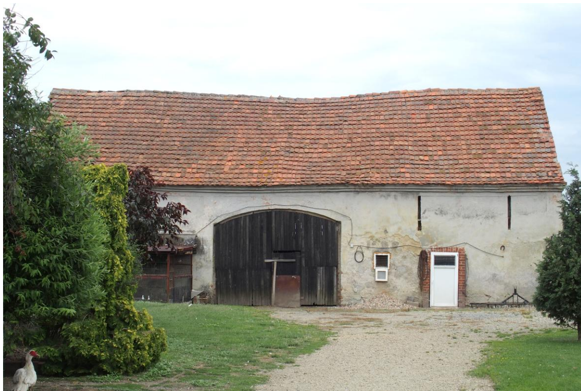
Widok od północnego zachodu

7. Fotografia z opisem wskazującym orientację w stosunku do sąsiednich terenów lub stron świata albo mapa z zaznaczonym stanowiskiem archeologicznym