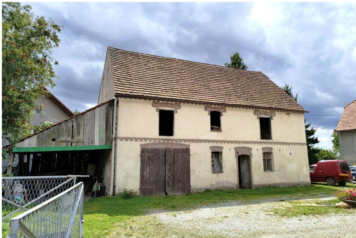
Widok od północnego wschodu

7. Fotografia z opisem wskazującym orientację w stosunku do sąsiednich terenów lub stron świata albo mapa z zaznaczonym stanowiskiem archeologicznym