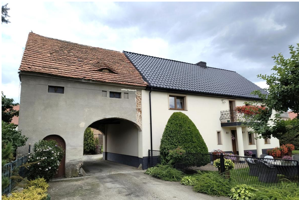
Widok od północnego zachodu

7. Fotografia z opisem wskazującym orientację w stosunku do sąsiednich terenów lub stron świata albo mapa z zaznaczonym stanowiskiem archeologicznym