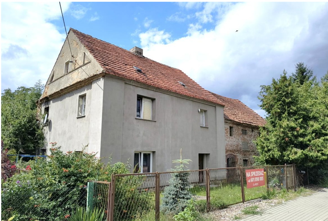
Widok od południowego wschodu

7. Fotografia z opisem wskazującym orientację w stosunku do sąsiednich terenów lub stron świata albo mapa z zaznaczonym stanowiskiem archeologicznym