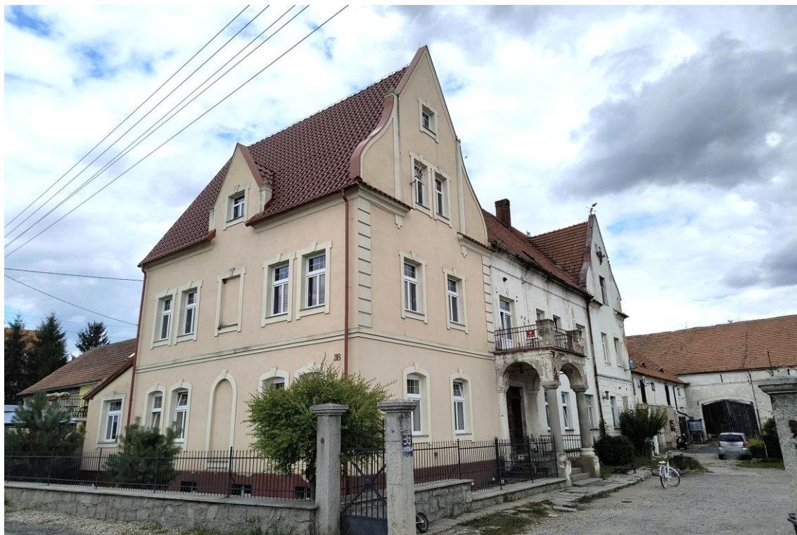
Widok od południowego zachodu

7. Fotografia z opisem wskazującym orientację w stosunku do sąsiednich terenów lub stron świata albo mapa z zaznaczonym stanowiskiem archeologicznym