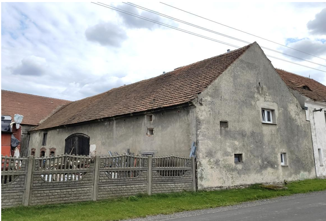
Widok od północnego zachodu

7. Fotografia z opisem wskazującym orientację w stosunku do sąsiednich terenów lub stron świata albo mapa z zaznaczonym stanowiskiem archeologicznym