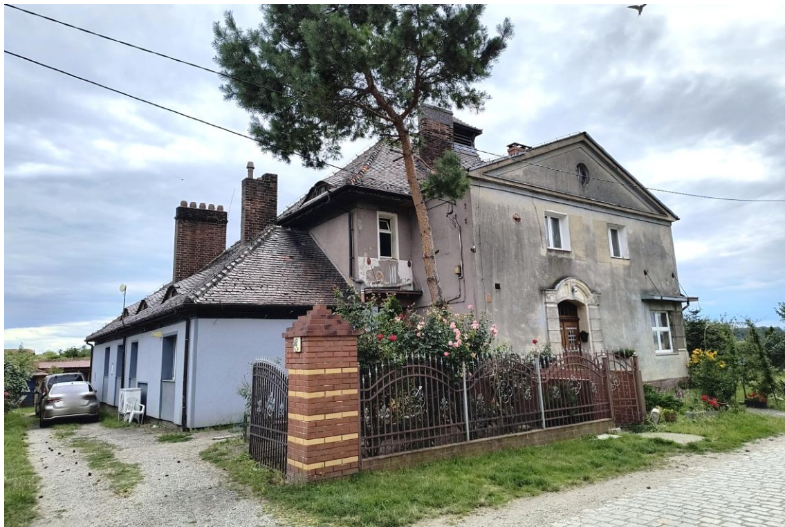
Widok od północnego wschodu

7. Fotografia z opisem wskazującym orientację w stosunku do sąsiednich terenów lub stron świata albo mapa z zaznaczonym stanowiskiem archeologicznym