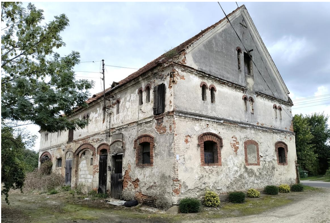
Widok od północnego wschodu

7. Fotografia z opisem wskazującym orientację w stosunku do sąsiednich terenów lub stron świata albo mapa z zaznaczonym stanowiskiem archeologicznym