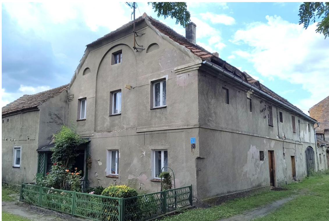
Widok od północnego wschodu

7. Fotografia z opisem wskazującym orientację w stosunku do sąsiednich terenów lub stron świata albo mapa z zaznaczonym stanowiskiem archeologicznym