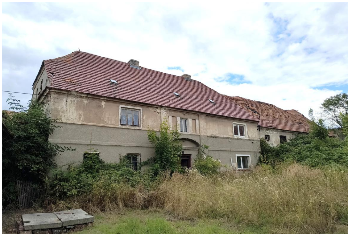
Widok od południowego zachodu

7. Fotografia z opisem wskazującym orientację w stosunku do sąsiednich terenów lub stron świata albo mapa z zaznaczonym stanowiskiem archeologicznym