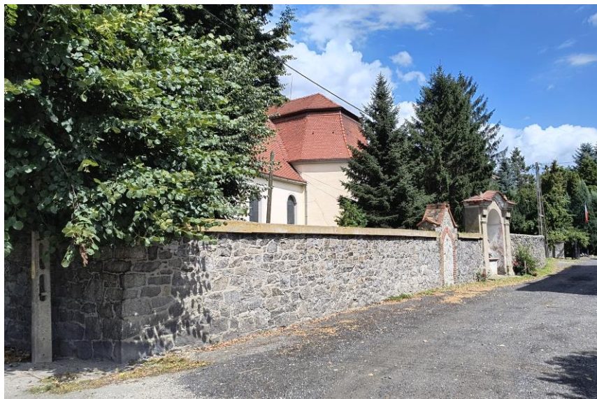
Widok od południowego zachodu

7. Fotografia z opisem wskazującym orientację w stosunku do sąsiednich terenów lub stron świata albo mapa z zaznaczonym stanowiskiem archeologicznym