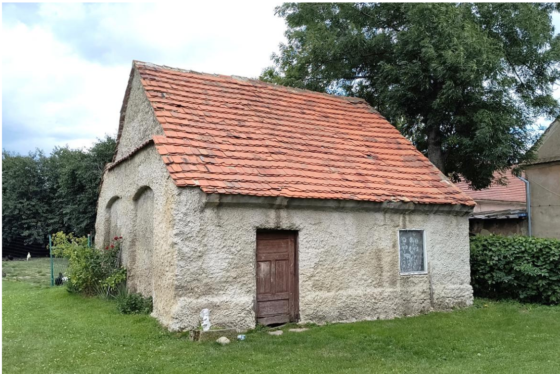
Widok od północnego zachodu

7. Fotografia z opisem wskazującym orientację w stosunku do sąsiednich terenów lub stron świata albo mapa z zaznaczonym stanowiskiem archeologicznym