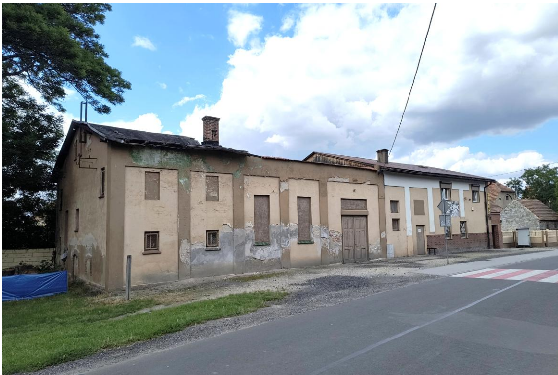
Widok od południowego wschodu

7. Fotografia z opisem wskazującym orientację w stosunku do sąsiednich terenów lub stron świata albo mapa z zaznaczonym stanowiskiem archeologicznym