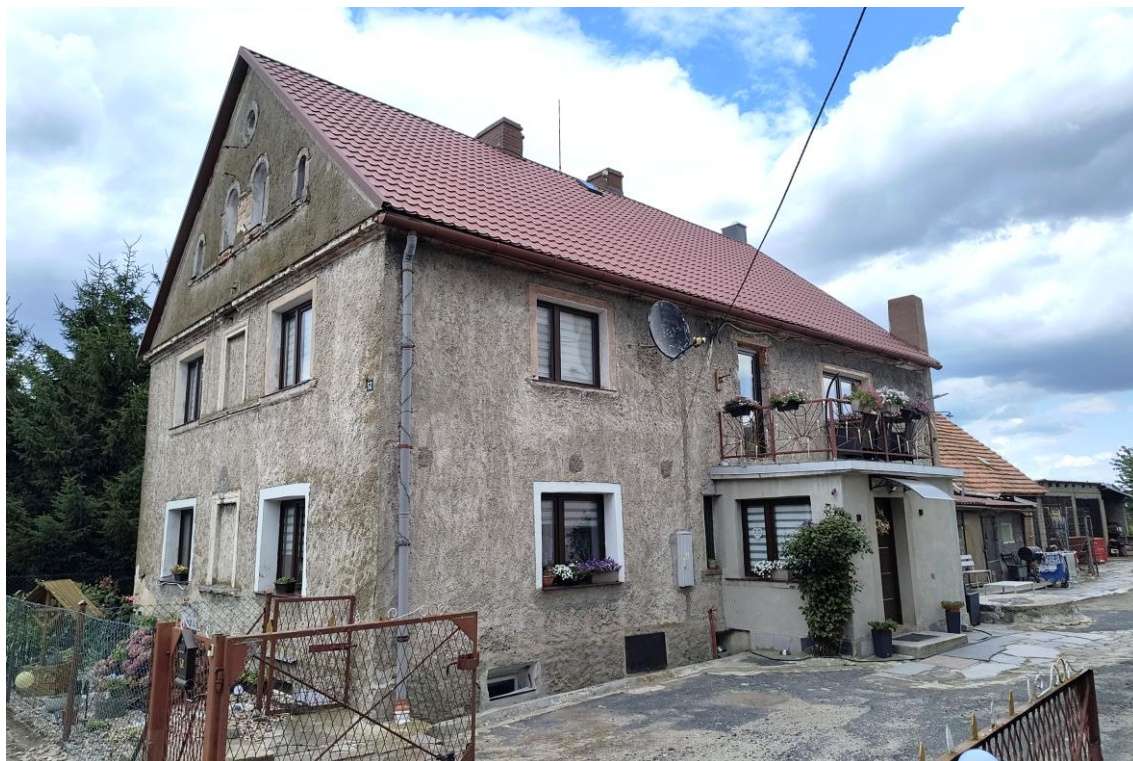
Widok od południowego zachodu

7. Fotografia z opisem wskazującym orientację w stosunku do sąsiednich terenów lub stron świata albo mapa z zaznaczonym stanowiskiem archeologicznym