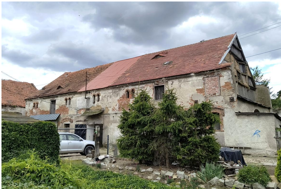
Widok od północnego zachodu

7. Fotografia z opisem wskazującym orientację w stosunku do sąsiednich terenów lub stron świata albo mapa z zaznaczonym stanowiskiem archeologicznym