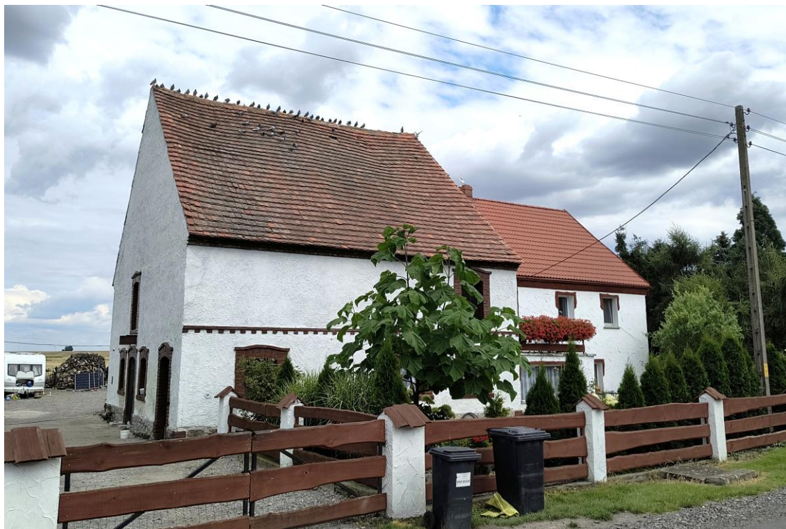
Widok od północnego zachodu

7. Fotografia z opisem wskazującym orientację w stosunku do sąsiednich terenów lub stron świata albo mapa z zaznaczonym stanowiskiem archeologicznym