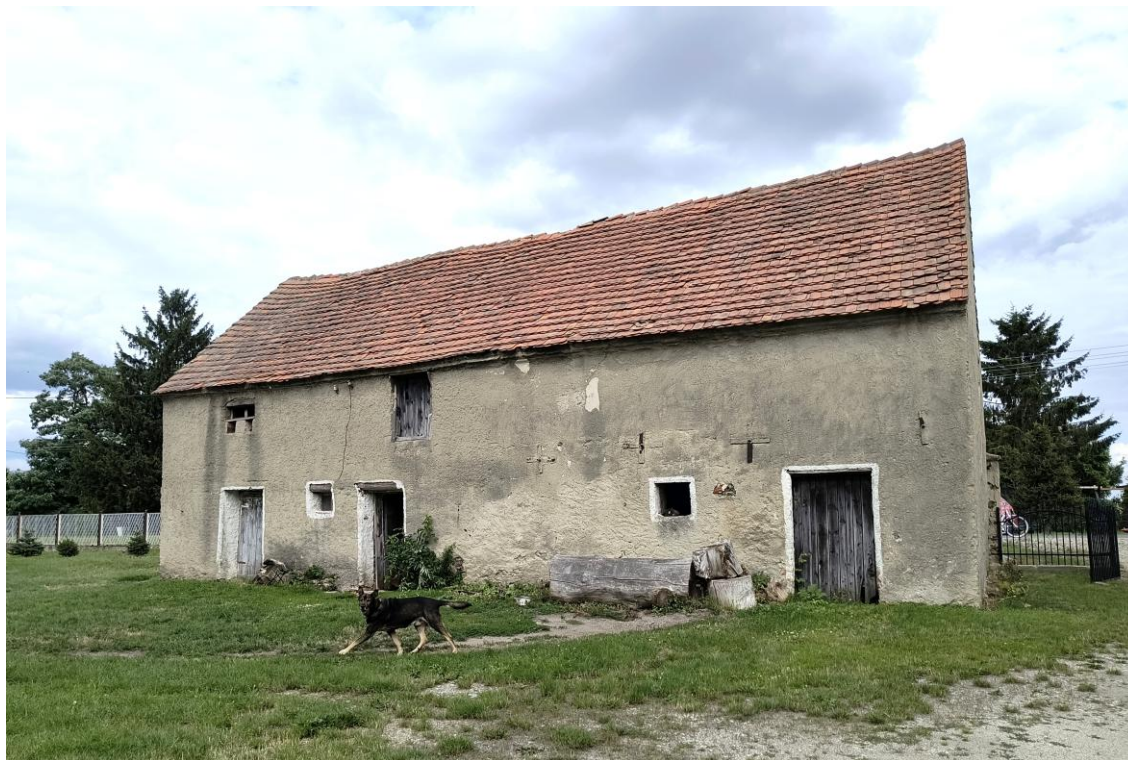
Widok od południowego zachodu

7. Fotografia z opisem wskazującym orientację w stosunku do sąsiednich terenów lub stron świata albo mapa z zaznaczonym stanowiskiem archeologicznym