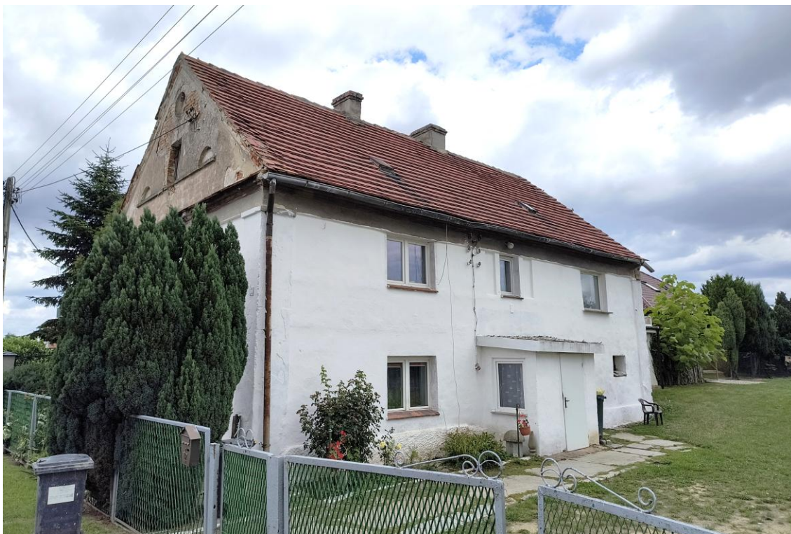
Widok od południowego zachodu

7. Fotografia z opisem wskazującym orientację w stosunku do sąsiednich terenów lub stron świata albo mapa z zaznaczonym stanowiskiem archeologicznym