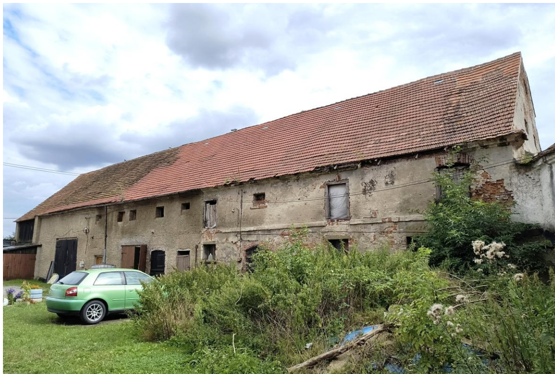
Widok od północnego zachodu

7. Fotografia z opisem wskazującym orientację w stosunku do sąsiednich terenów lub stron świata albo mapa z zaznaczonym stanowiskiem archeologicznym