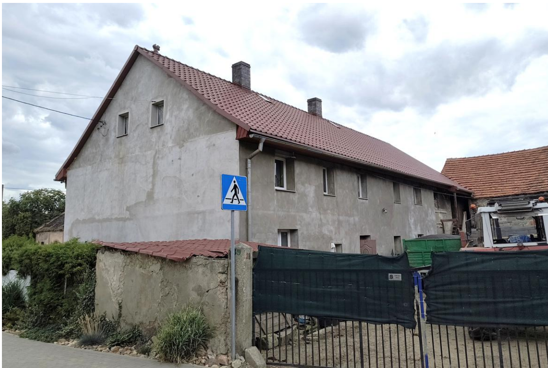
Widok od północnego zachodu

7. Fotografia z opisem wskazującym orientację w stosunku do sąsiednich terenów lub stron świata albo mapa z zaznaczonym stanowiskiem archeologicznym