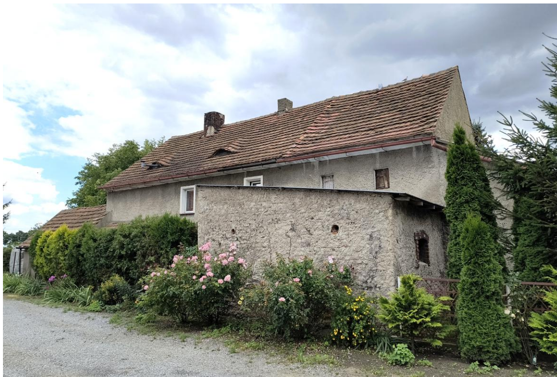
Widok od północnego zachodu

7. Fotografia z opisem wskazującym orientację w stosunku do sąsiednich terenów lub stron świata albo mapa z zaznaczonym stanowiskiem archeologicznym