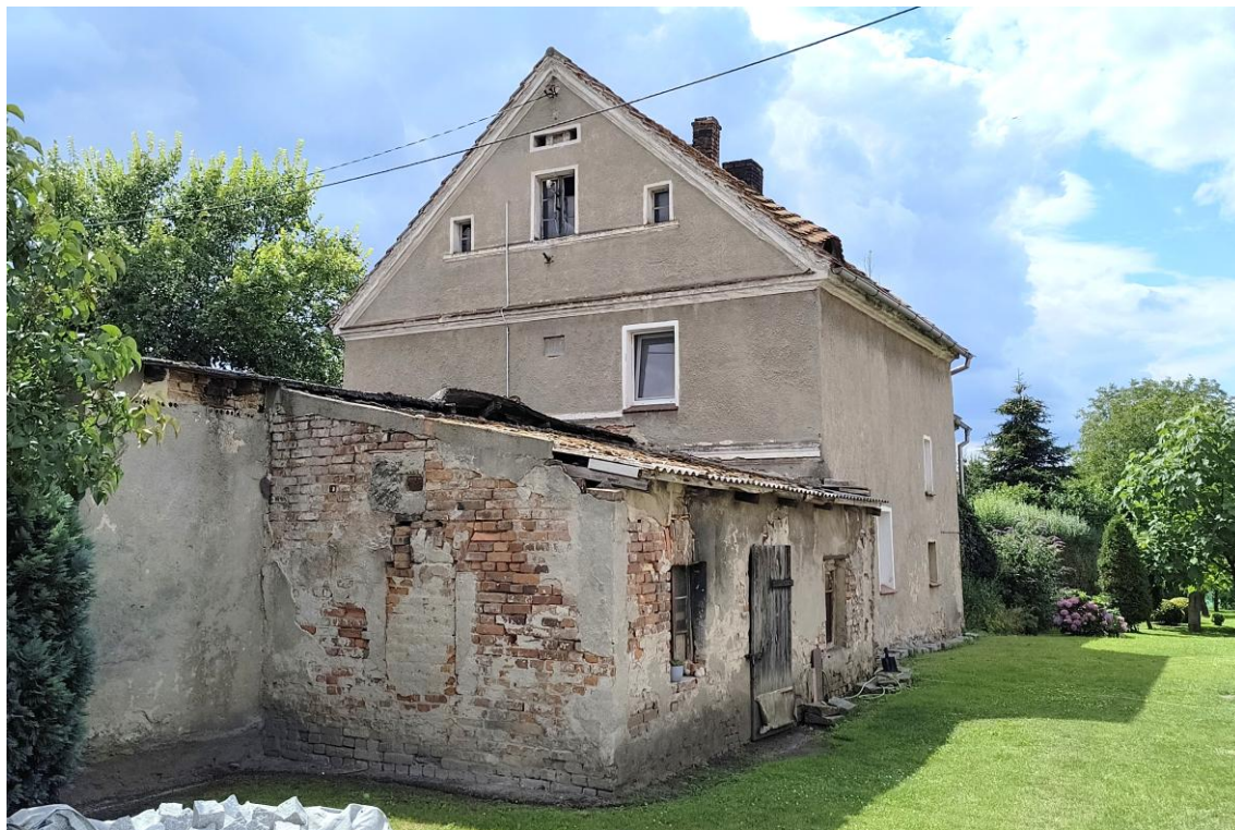
Widok od północnego wschodu

7. Fotografia z opisem wskazującym orientację w stosunku do sąsiednich terenów lub stron świata albo mapa z zaznaczonym stanowiskiem archeologicznym