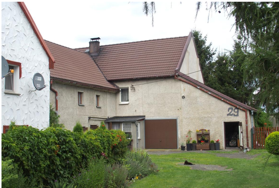
Widok od południowego zachodu

7. Fotografia z opisem wskazującym orientację w stosunku do sąsiednich terenów lub stron świata albo mapa z zaznaczonym stanowiskiem archeologicznym