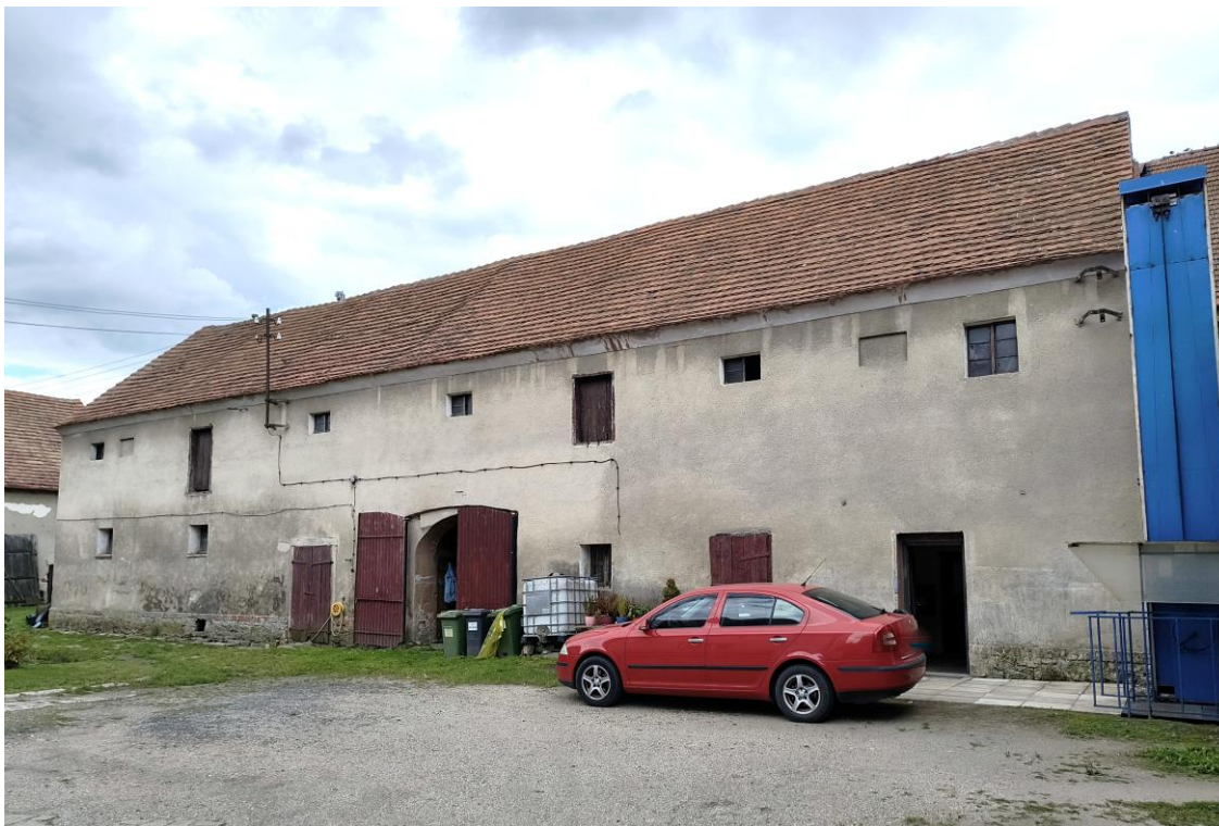
Widok od północnego zachodu

7. Fotografia z opisem wskazującym orientację w stosunku do sąsiednich terenów lub stron świata albo mapa z zaznaczonym stanowiskiem archeologicznym