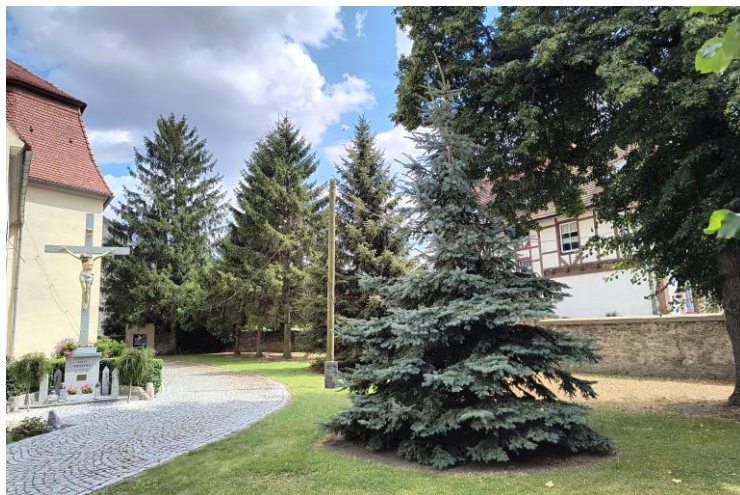
Widok od północnego zachodu

7. Fotografia z opisem wskazującym orientację w stosunku do sąsiednich terenów lub stron świata albo mapa z zaznaczonym stanowiskiem archeologicznym