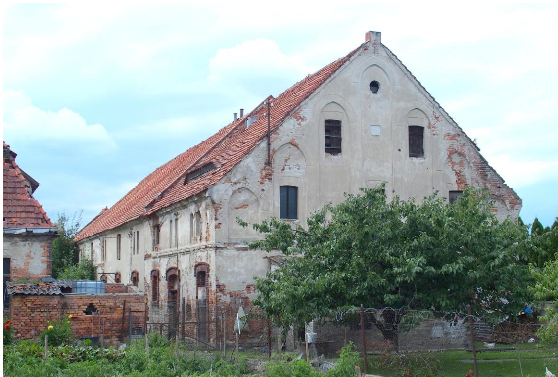
Widok od południowego zachodu

7. Fotografia z opisem wskazującym orientację w stosunku do sąsiednich terenów lub stron świata albo mapa z zaznaczonym stanowiskiem archeologicznym