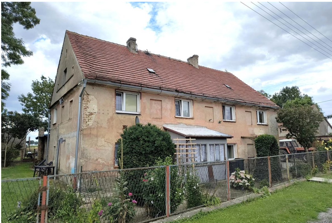
Widok od północnego zachodu

7. Fotografia z opisem wskazującym orientację w stosunku do sąsiednich terenów lub stron świata albo mapa z zaznaczonym stanowiskiem archeologicznym