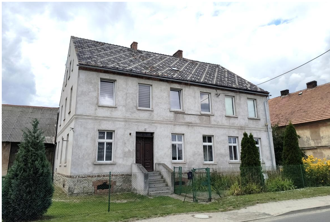
Widok od południowego wschodu

7. Fotografia z opisem wskazującym orientację w stosunku do sąsiednich terenów lub stron świata albo mapa z zaznaczonym stanowiskiem archeologicznym