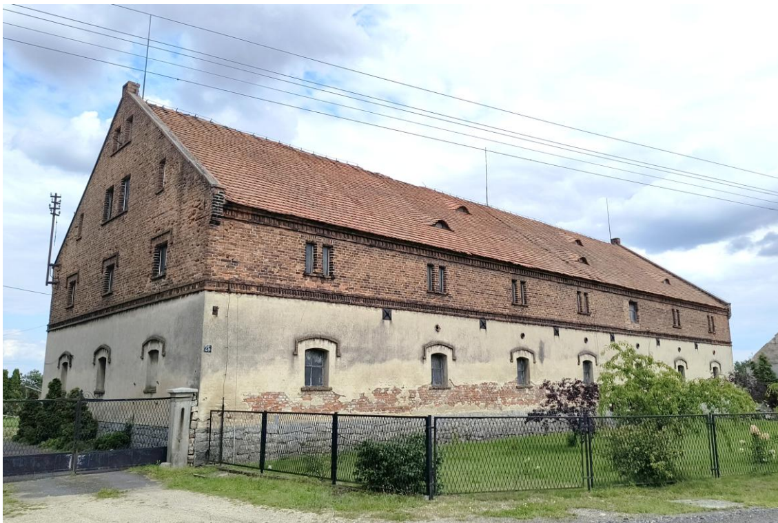
Widok od północnego zachodu

7. Fotografia z opisem wskazującym orientację w stosunku do sąsiednich terenów lub stron świata albo mapa z zaznaczonym stanowiskiem archeologicznym