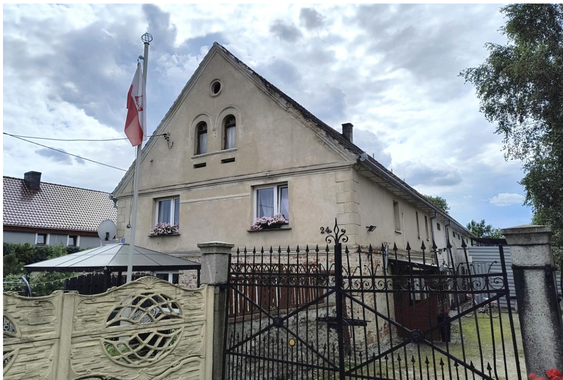
Widok od północnego wschodu

7. Fotografia z opisem wskazującym orientację w stosunku do sąsiednich terenów lub stron świata albo mapa z zaznaczonym stanowiskiem archeologicznym