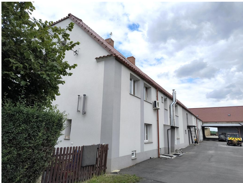
Widok od południowego zachodu

7. Fotografia z opisem wskazującym orientację w stosunku do sąsiednich terenów lub stron świata albo mapa z zaznaczonym stanowiskiem archeologicznym