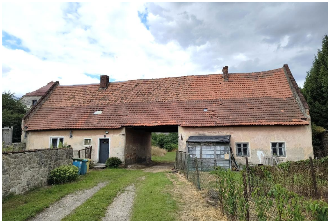
Widok od północnego zachodu

7. Fotografia z opisem wskazującym orientację w stosunku do sąsiednich terenów lub stron świata albo mapa z zaznaczonym stanowiskiem archeologicznym