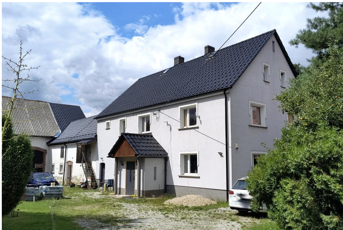
Widok od południowego wschodu

7. Fotografia z opisem wskazującym orientację w stosunku do sąsiednich terenów lub stron świata albo mapa z zaznaczonym stanowiskiem archeologicznym