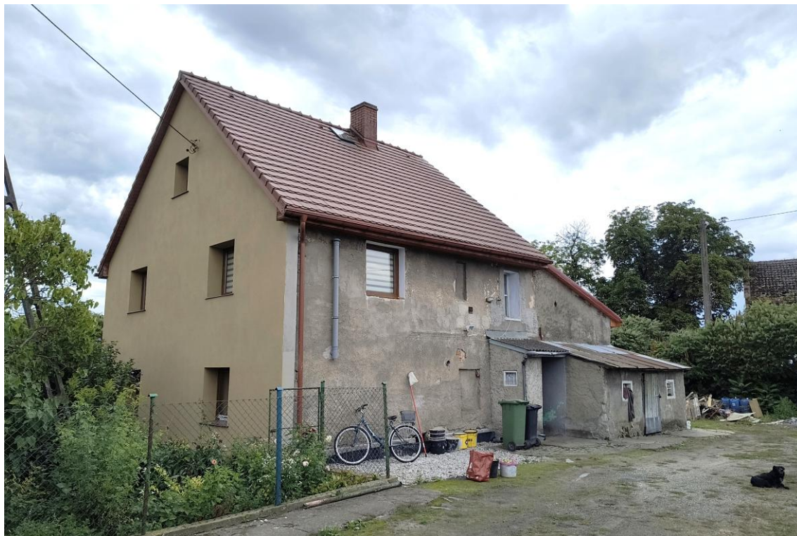
Widok od północnego wschodu

7. Fotografia z opisem wskazującym orientację w stosunku do sąsiednich terenów lub stron świata albo mapa z zaznaczonym stanowiskiem archeologicznym