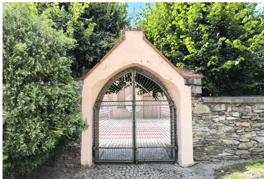
Widok od południowego wschodu