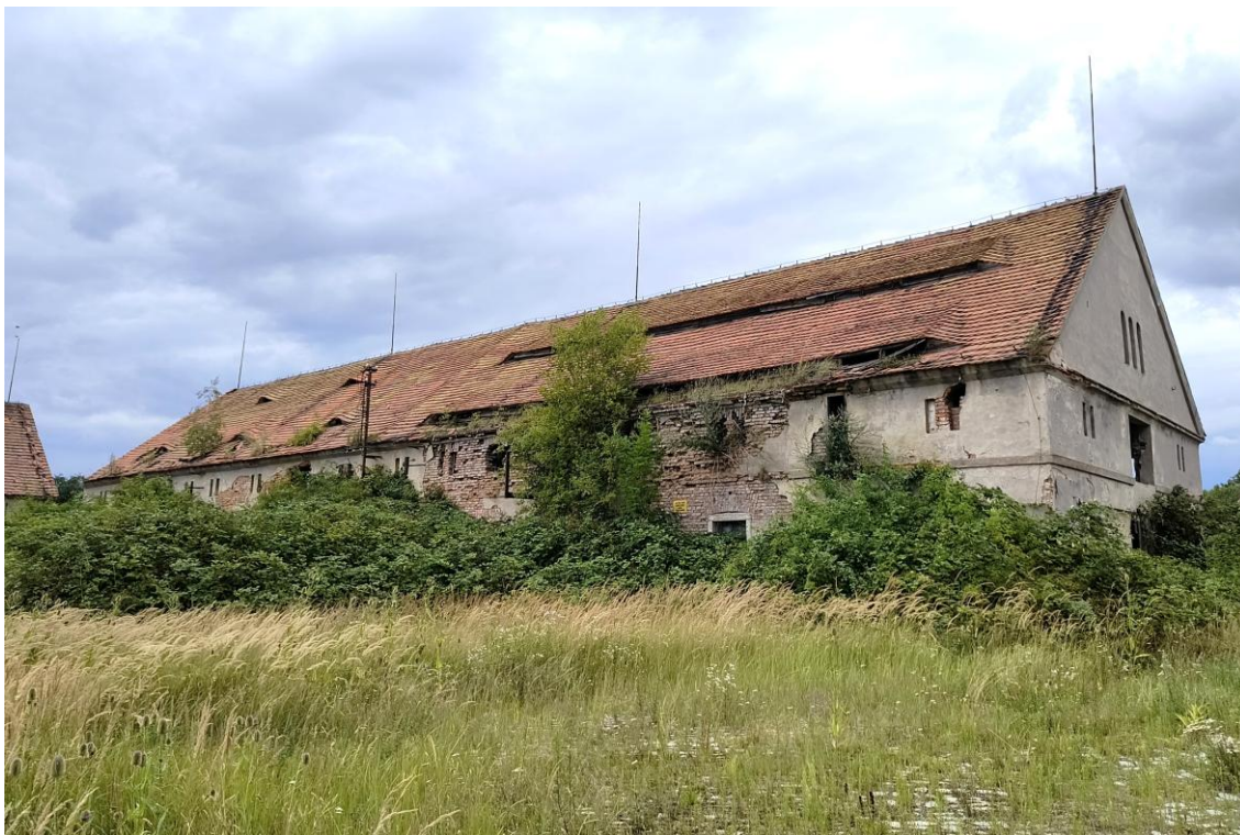
Widok od południowego wschodu

7. Fotografia z opisem wskazującym orientację w stosunku do sąsiednich terenów lub stron świata albo mapa z zaznaczonym stanowiskiem archeologicznym