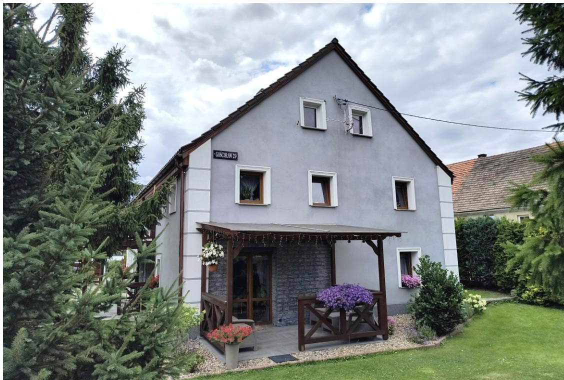
Widok od południowego wschodu

7. Fotografia z opisem wskazującym orientację w stosunku do sąsiednich terenów lub stron świata albo mapa z zaznaczonym stanowiskiem archeologicznym