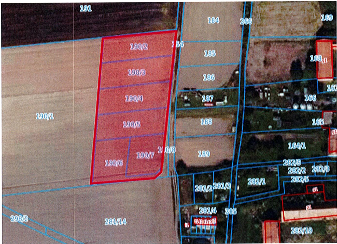
Działki budowlane obręb Gościśław gm.Udanin