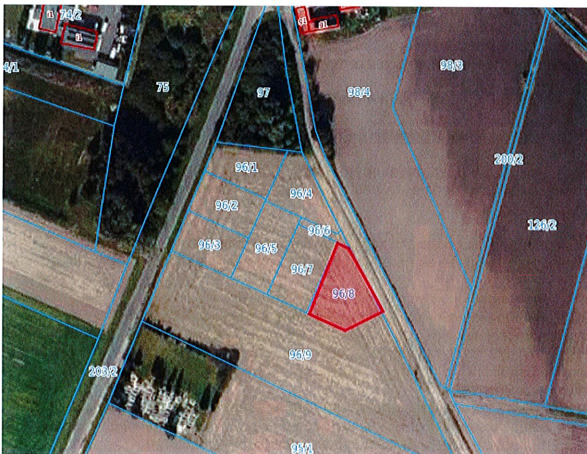
Działka w miejscowości Jarosław gm. Udanin. (600 m od autostrady A-4)